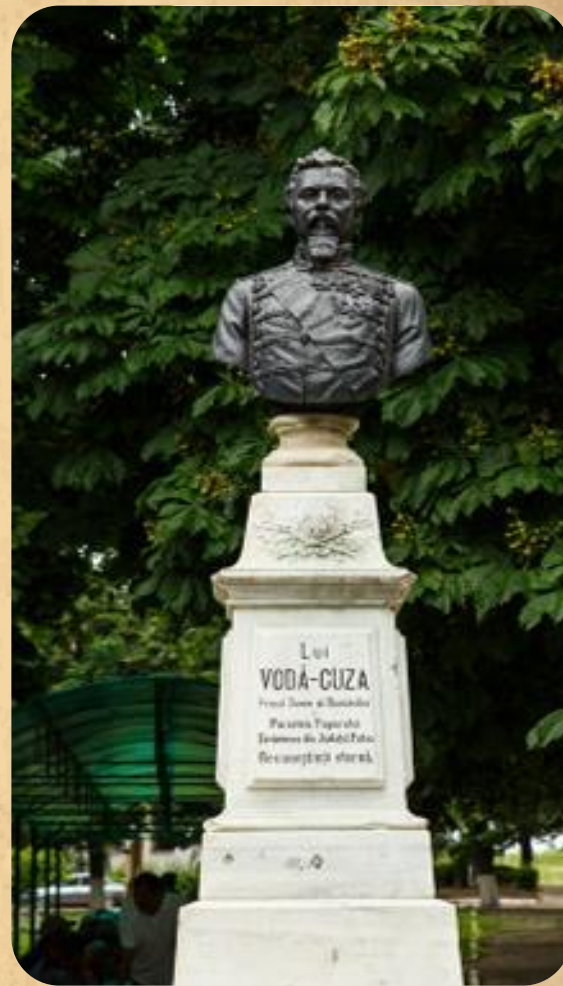
Bustul domnitorului Alexandru Ioan Cuza